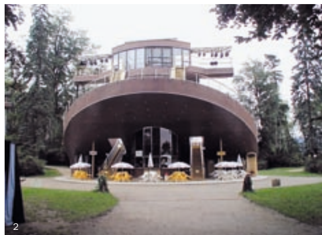
Obr. 1, 2. Český Krumlov, státní hrad a zámek, zámecká zahrada, srovnání historického stavu zámecké zahrady a současného stavu s otáčivým hledištěm.

V souboru článků o českokrumlovském otáčivém hledišti není možné pominout mezinárodní rozměr problematiky.